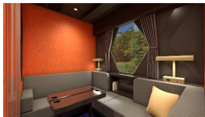
△コンパートメント (イメージ)