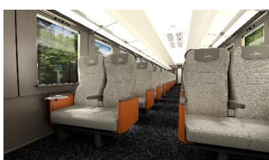
△スタンダードシート (イメージ)