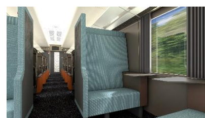
△ボックスシート (イメージ)