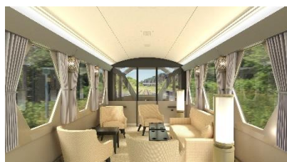
△コックピットシート (イメージ)

現行のスペーシアを継承しながらもより上質な空間となった個室をはじめ、全6種類のシートの中からお客様それぞれの旅行スタイルに合うものを選んでいただけます。