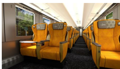
△プレミアムシート (イメージ)