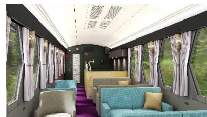
△コックピットラウンジ (イメージ)